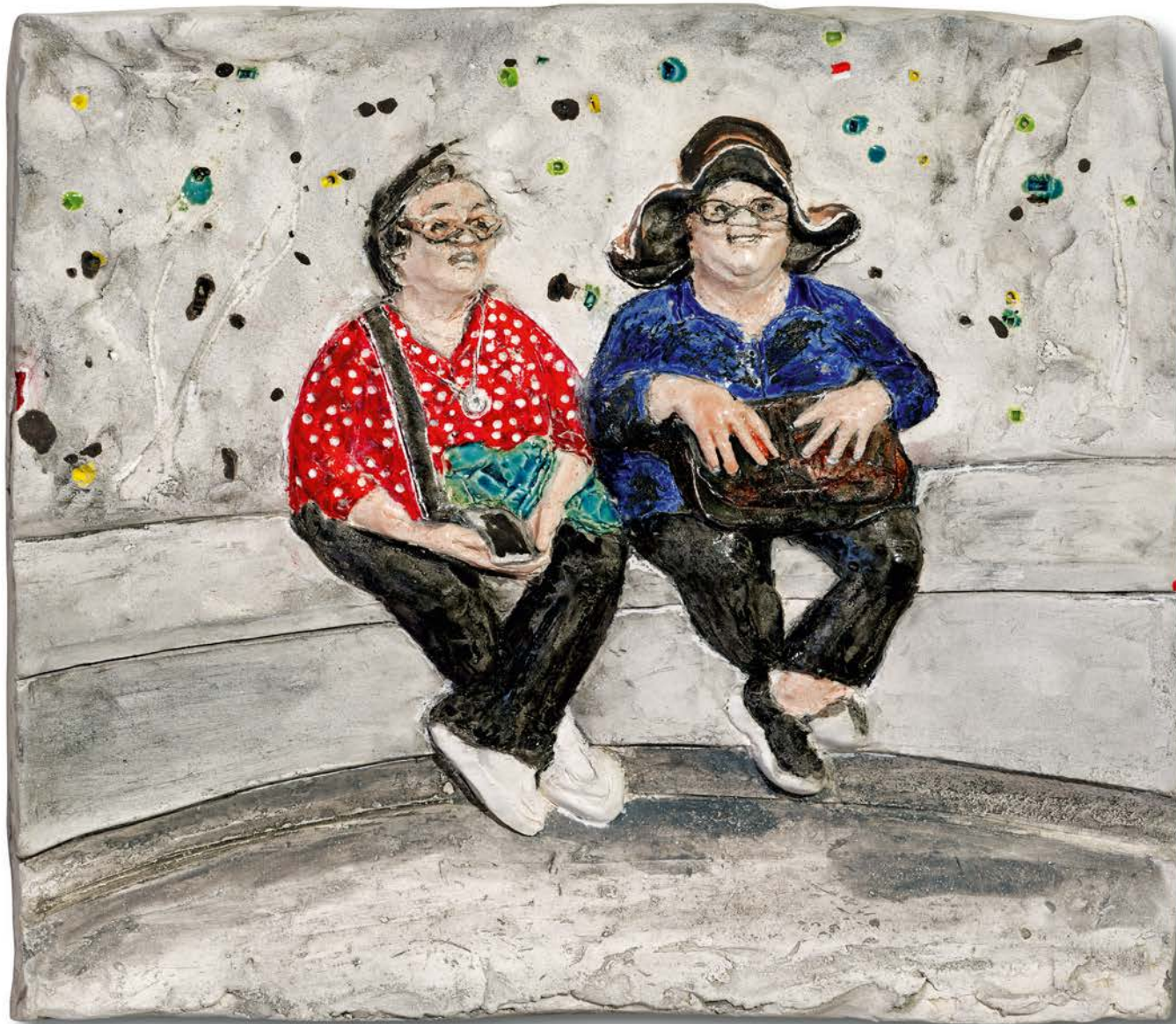
ENTRÜCKT · 2023 · Keramik, glasiert, bemalt · H 30 cm, B 33 cm, T 4 cm