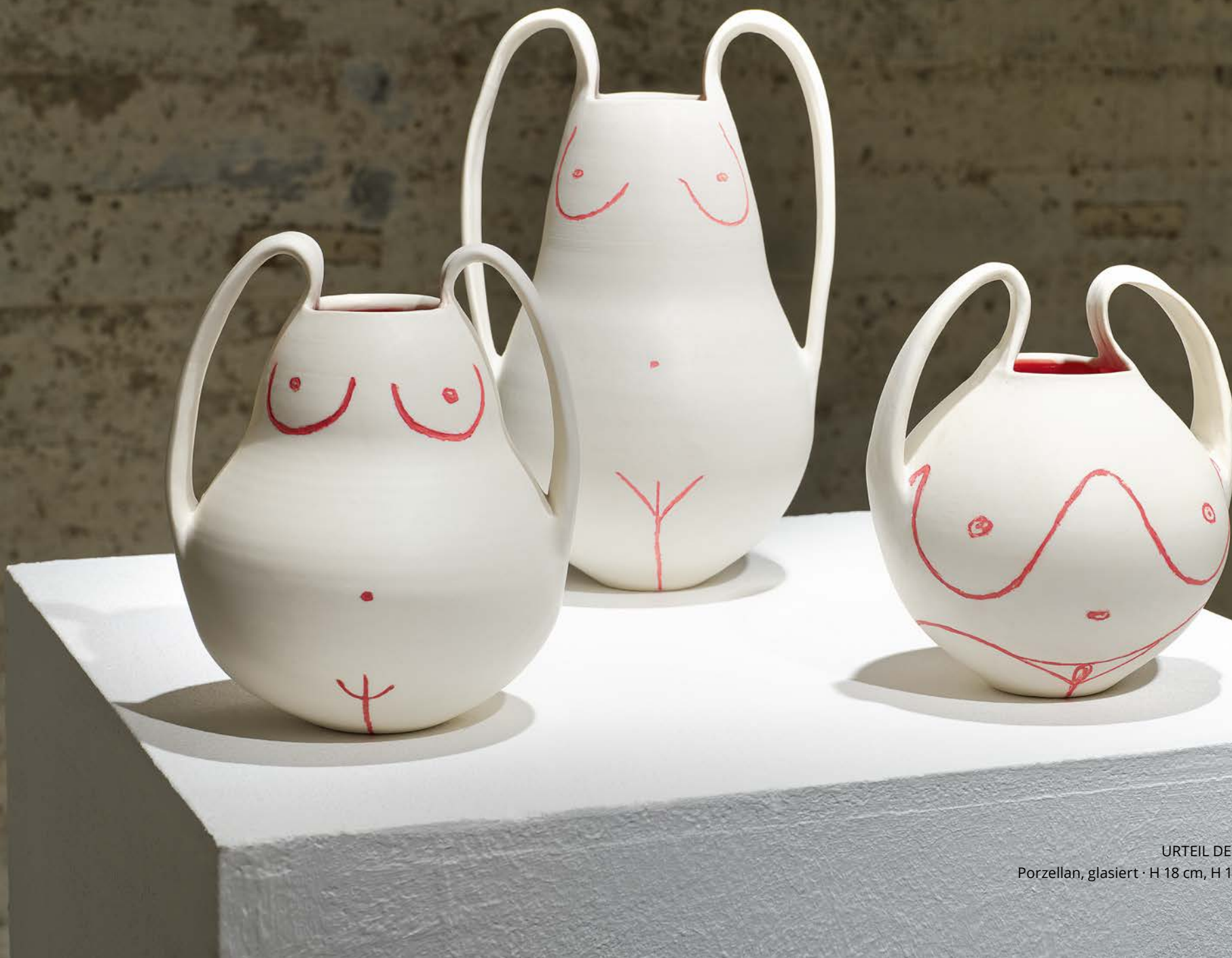
URTEIL DES PARIS · 2022 Porzellan, glasiert · H 18 cm, H 19 cm, H 27 cm Form: Eva Koj