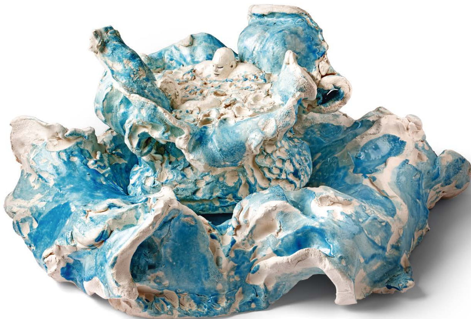
WHIRLPOOL · 2023 Keramik, glasiert · H 27 cm, Ø 50 cm