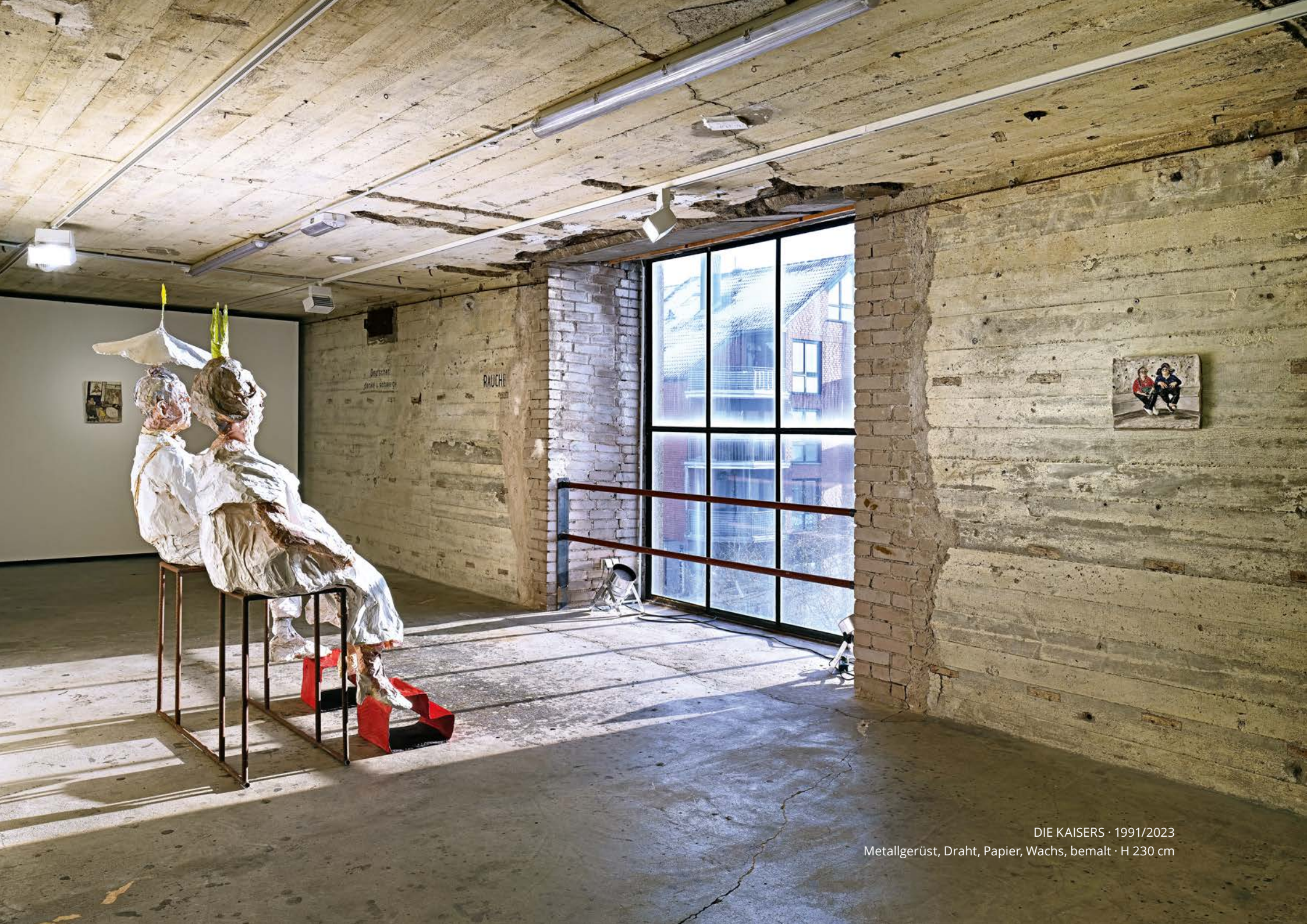
DIE KAISERS · 1991/2023 Metallgerüst, Draht, Papier, Wachs, bemalt · H 230 cm