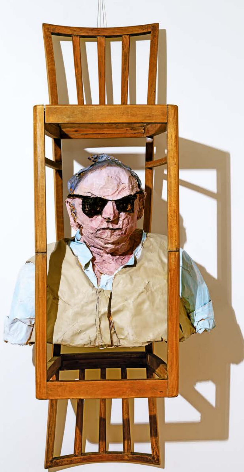
VORSITZ · 1991 Stühle, Draht, Papier, bemalt · H 160 cm