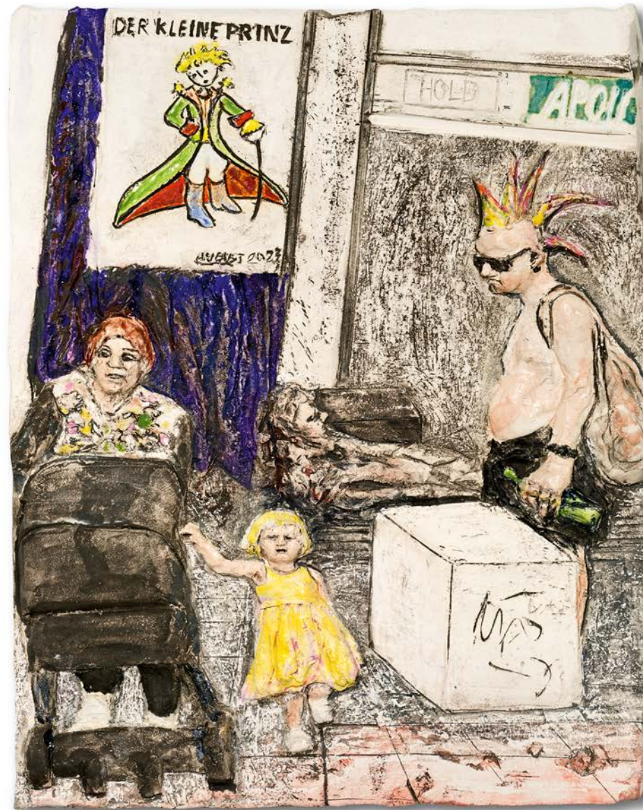
LAZARUS · 2023 · Keramik, glasiert · H 40 cm, B 30 cm, T 4 cm