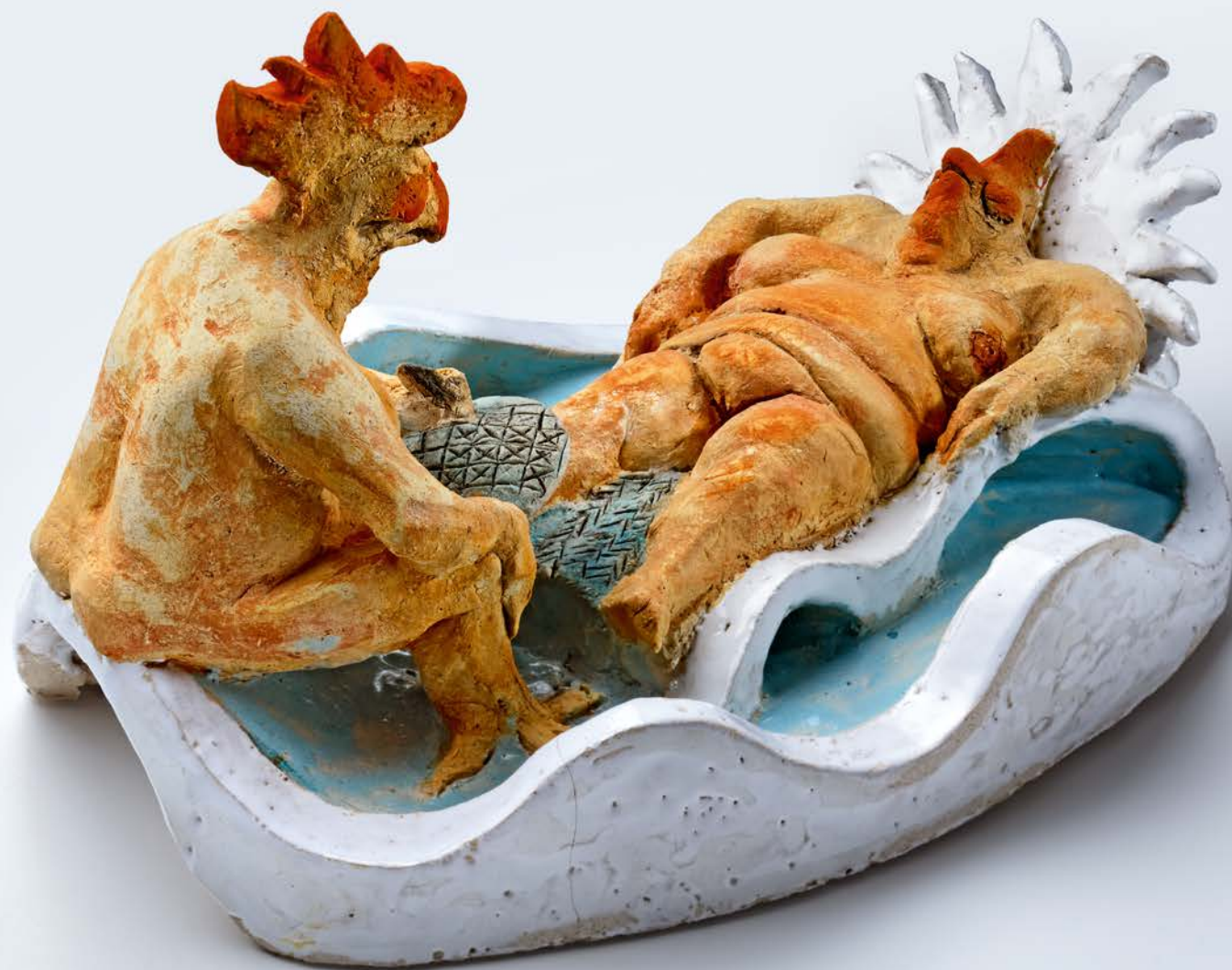
KREUZFAHRT I · 2014 Keramik, glasiert, bemalt · H 20 cm, Ø 35 cm