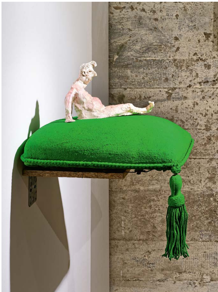
AUSGEZEICHNET · 1992 · Keramik, Kissen · B 37, T 35