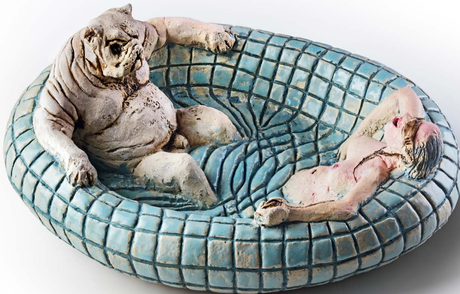
KREUZFAHRT II · 2014 Keramik, glasiert, bemalt · H 15 cm, Ø 33 cm