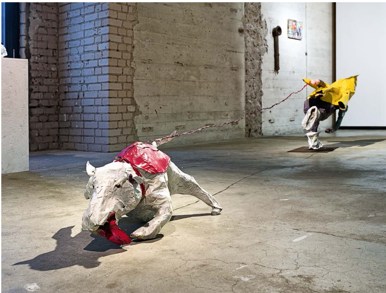
WIDERLINGE · 1991/2023 · Draht, Papier, bemalt · H 85 cm