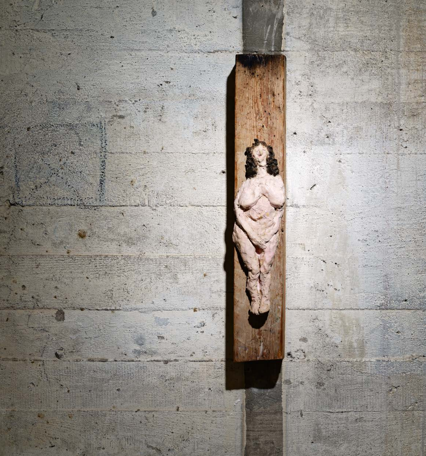
PECHMARIE · 1992

Keramik, bemalt, Holz · H 60 cm, B 9 cm, T 9 cm