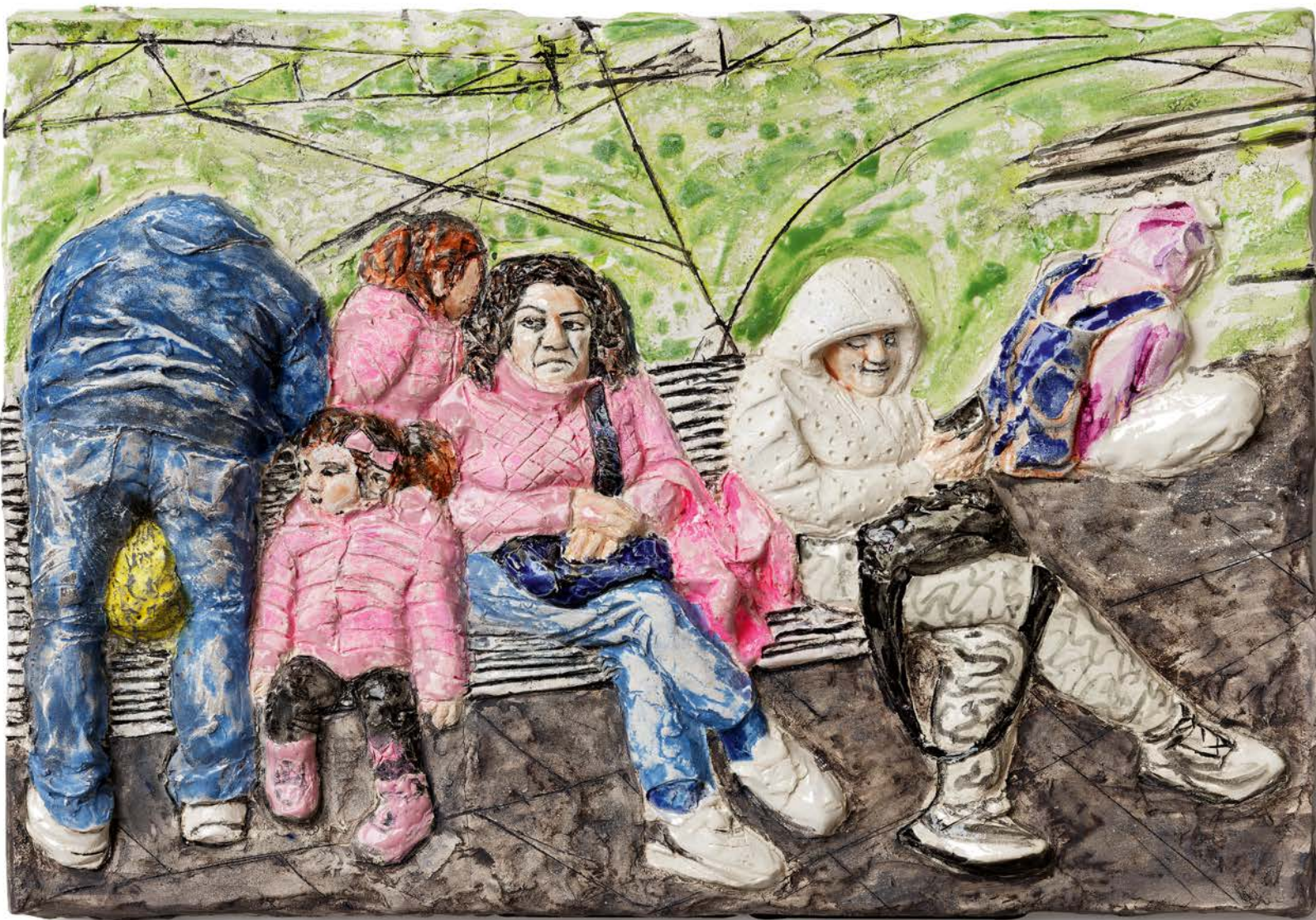
LA VIE EN ROSE · 2023 · Keramik, glasiert, bemalt · H 30 cm, B 40 cm, T 4 cm