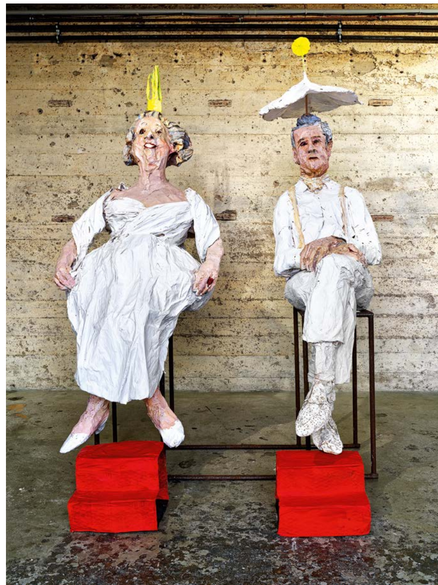
DIE KAISERS · 1991/2023 Metallgerüst, Draht, Papier, Wachs, bemalt · H 230 cm