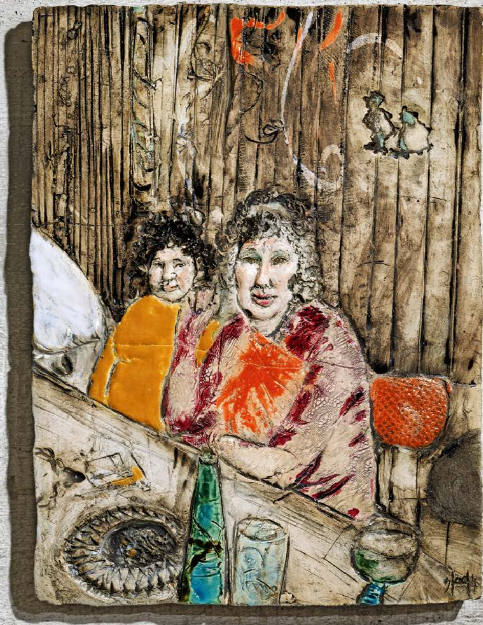
VEREINSHEIM I · 1992

Keramik, glasiert · H 35 cm, B 26 cm, T 2 cm