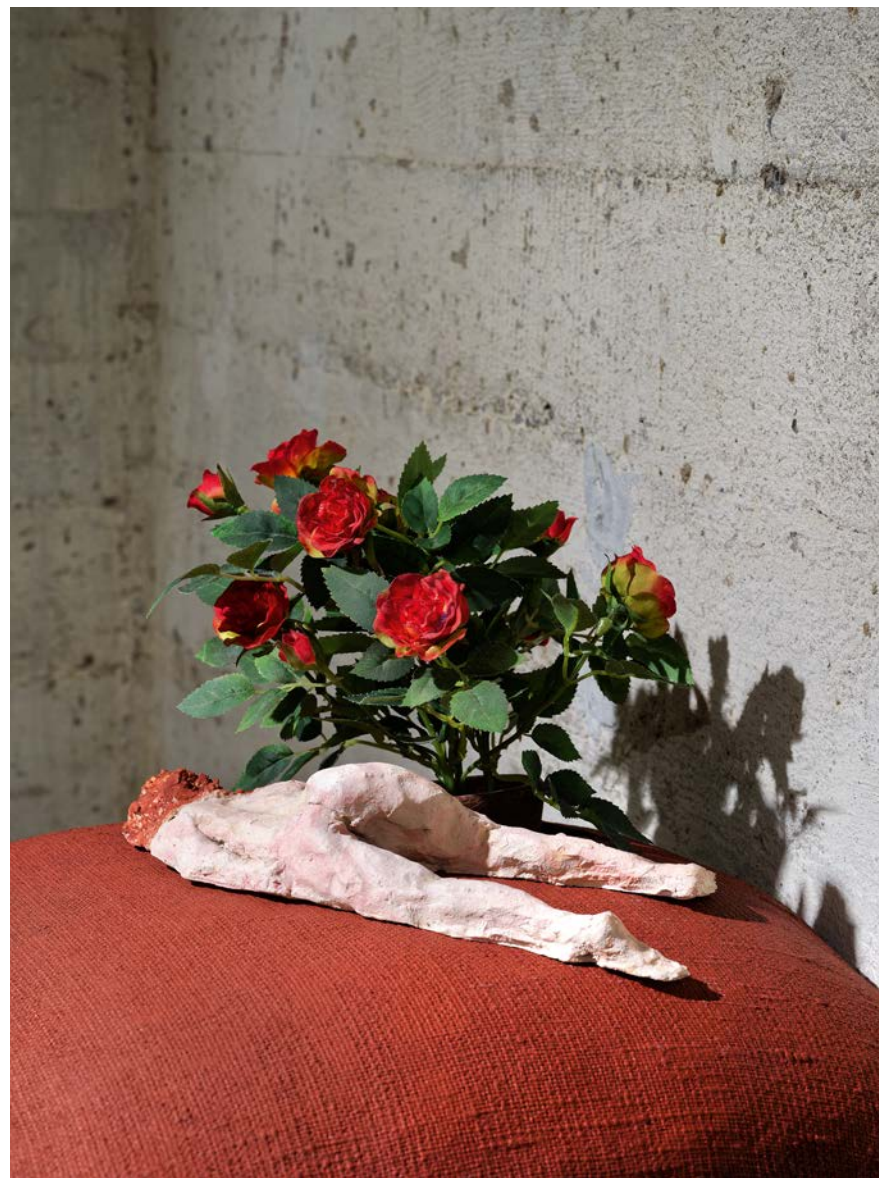
SÜSSER SCHLUMMER · 1992 · Keramik, Kissen, Kunstrose · B 37, T 35