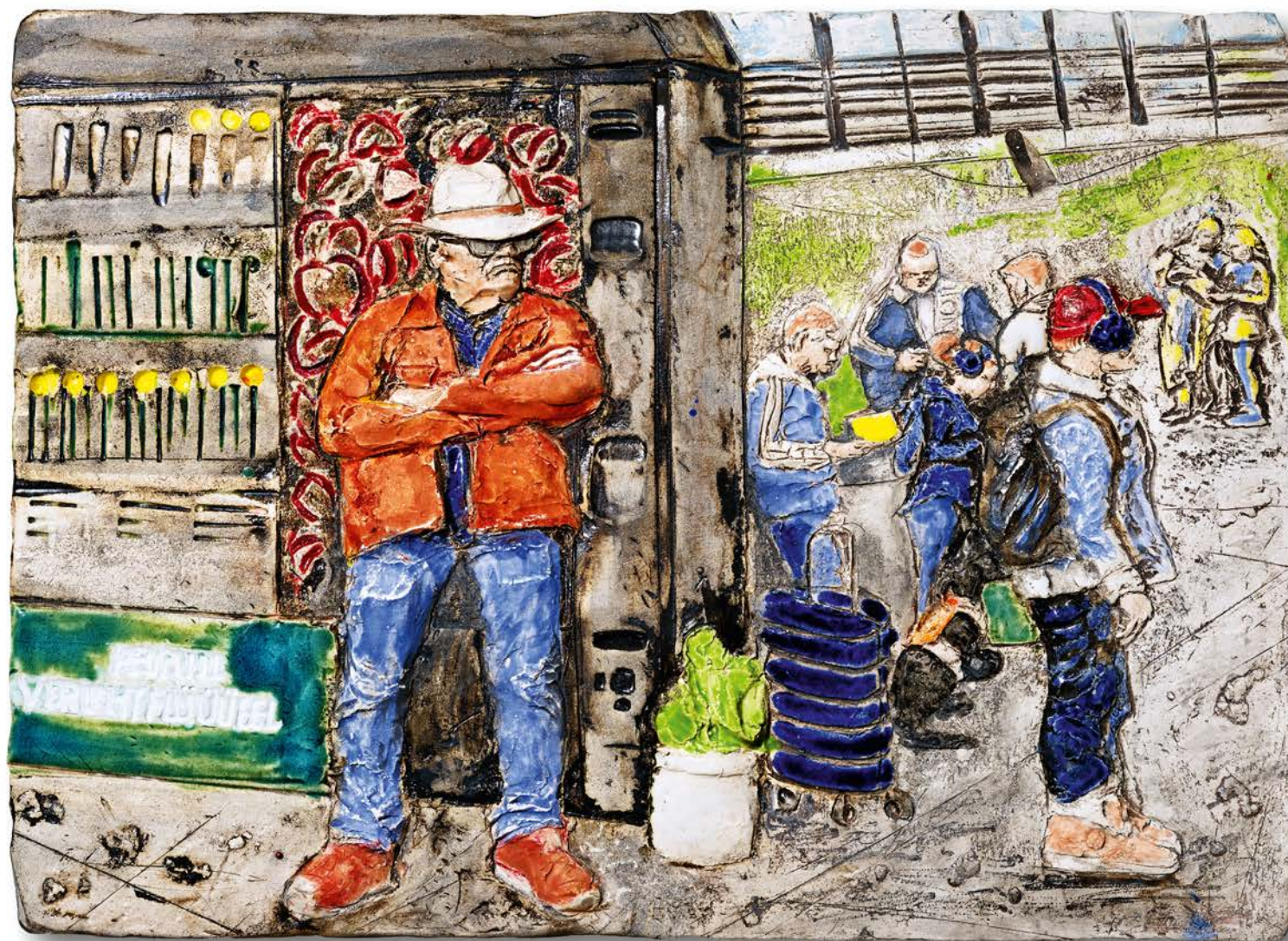
ANSTAND · 2023 · Keramik, glasiert · H 30 cm, B 40 cm, T 4cm