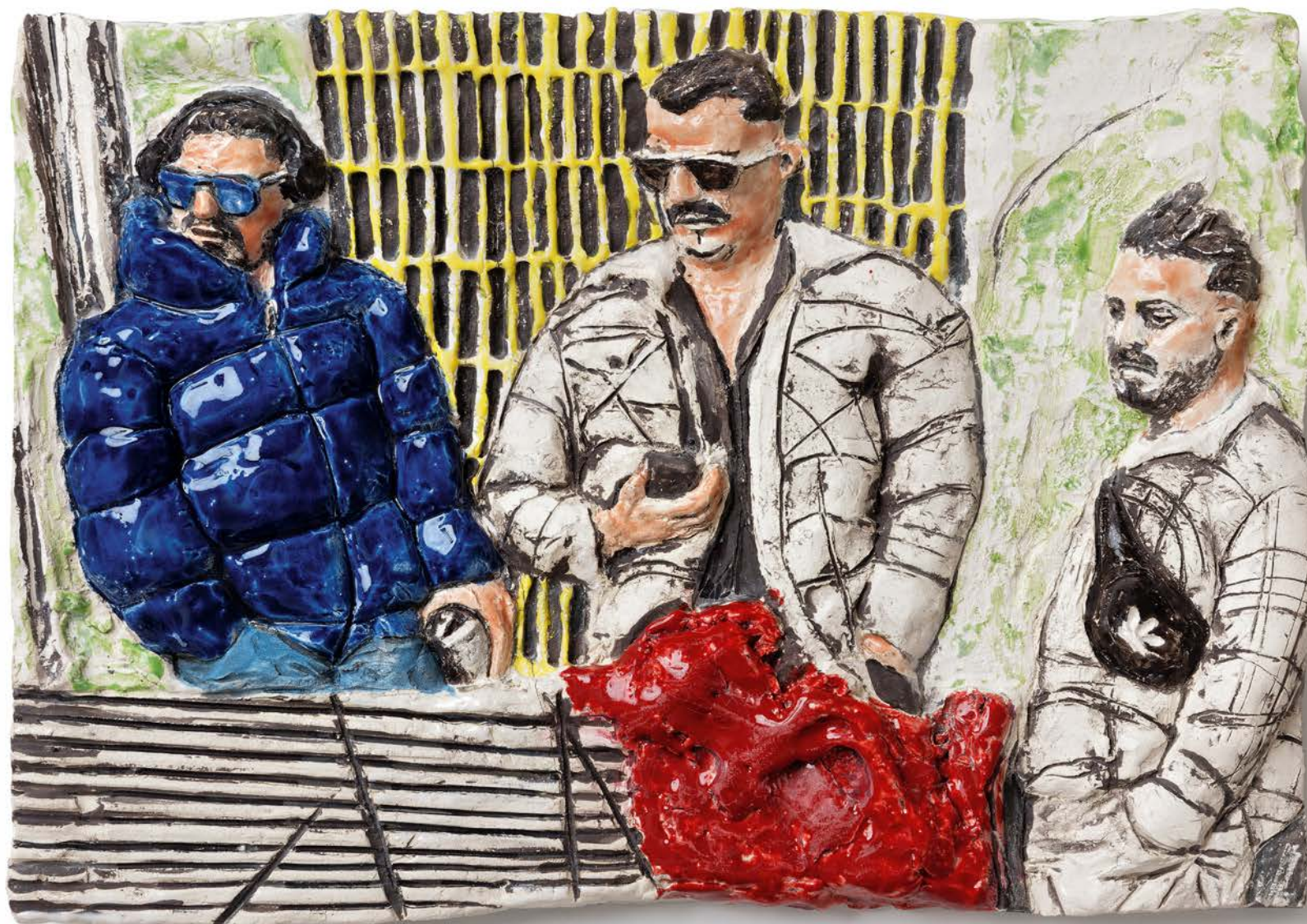
DRILLING · 2023 · Keramik, glasiert · H 29 cm, B 40 cm, T 4 cm